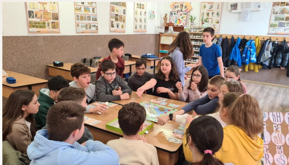
Lecție despre verde