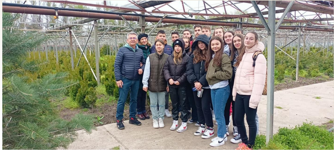
Vizită la sere Pepiniera Suceava