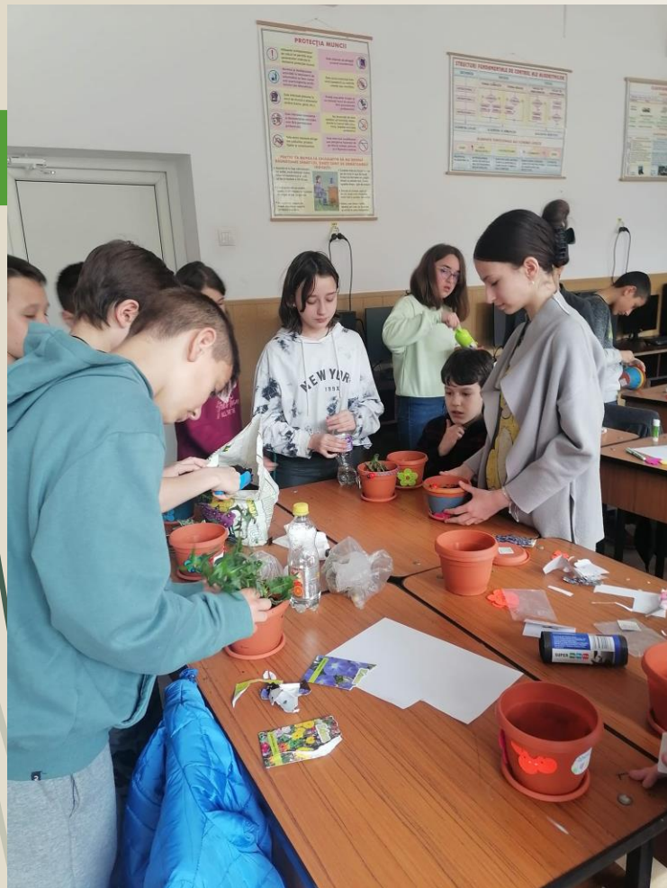
Plantarea florilor ornamentale