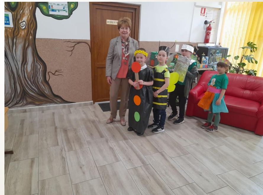
Parada costumelor eco Parada florilor